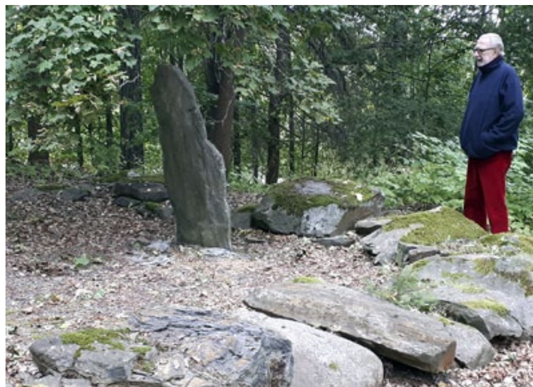
Nokian kartanokappelista (1505–1529) on jäljellä enää rauniot.