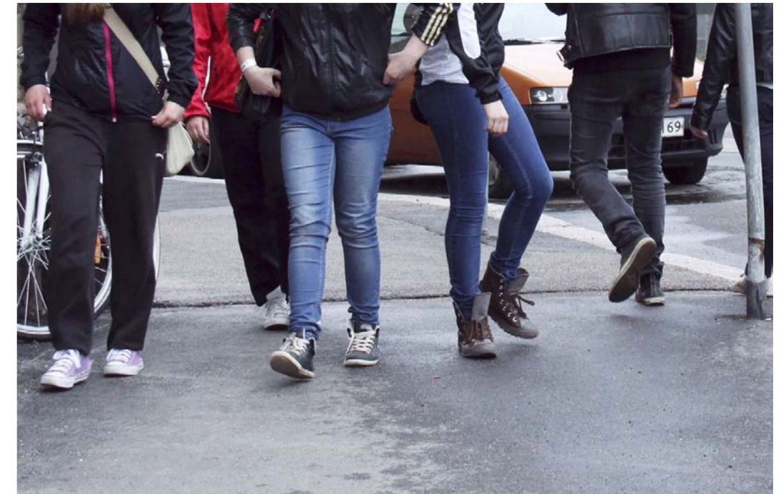
Väkivalta ja konfliktit kurjistavat nuorten elämää yhä enemmän. Lasten ja nuorten tekemä väkivalta on aina oire jostakin.

Lapsen ja nuoren tekemä väkivalta on aina oire jostakin. Lapsuus ja nuoruus kehitysvaiheina altistavat konflikteille, mutta väkivallan teot ja pitkittynyt kiusaaminen kertovat enemmän juurisista. Niitä voi löytyä esimerkiksi perhetaustasta, ympäristön käytösmalleista, sosi-