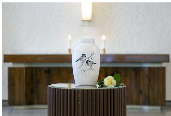
Vainajien tuhkaus yleistyy vuosi vuodelta.

Kirkollisten symbolien poistamisesta päätettiin kirkkoneuvostossa.