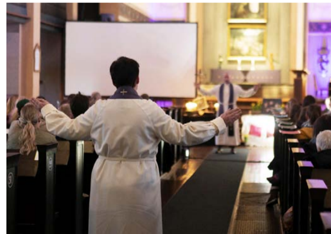
Nuorille suunnattu Hieman erilainen iltarukous pidettiin Taulumäen kirkossa.