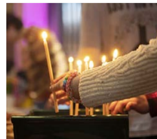
Jyväskylän Pääsiäisen tapahtumat puhuttelivat kaupunkilaisia.

Seurakunnan keräämässä yleisöpalautteessa monitaidefestivaalia kiiteltiin muun muassa musiikkitarjonnasta ja voimaannuttavista elämyksistä. Pääosin maksuttomaan ohjelmaan kuului lisäksi live art -konsertti, lasten taidetapahtuma ja Tuuli-Maaria