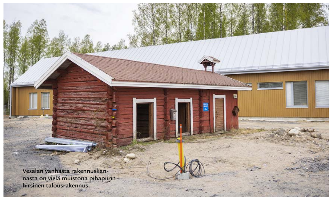
Vesalan vanhasta rakennuskannasta on vielä muistona pihapiirin hirsinen talousrakennus.

– Ajanmukaiset, modernit tilat ja ympäröivä luonto antavat hyvät puitteet yhteisöllisyyden rakentamiseen, lepoon, hiljaisuuteen ja hengellisyyteen.