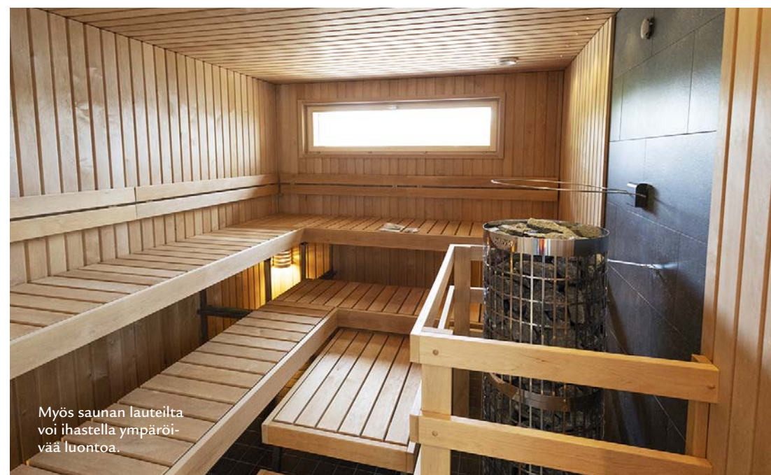
Myös saunan lauteilta voi ihailla ympäröivää luontoa.