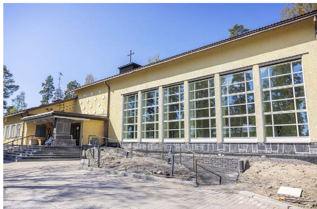
Vaajakosken kirkossa on tehty perusteellinen peruskorjaus. Kesän aikana remontoituidut tilat kalustetaan ja tuulettetaan. Pihatyöt viimeistellään kesä–heinäkuun aikana.

– Erittäin hyvältä ja toimivalta näyttää, hän sanoo ja jatkaa, että lähtöajatuksena on ollut tehdä kirkosta kodikas ja kutsuva, ja ette sinne olisi matala kynnyksillä. Remontoidut tilat luovutetaan seurakunnalle kesäkuun alussa, jonka jälkeen alkaa tilojen kalustaminen ja tuulettaminen.