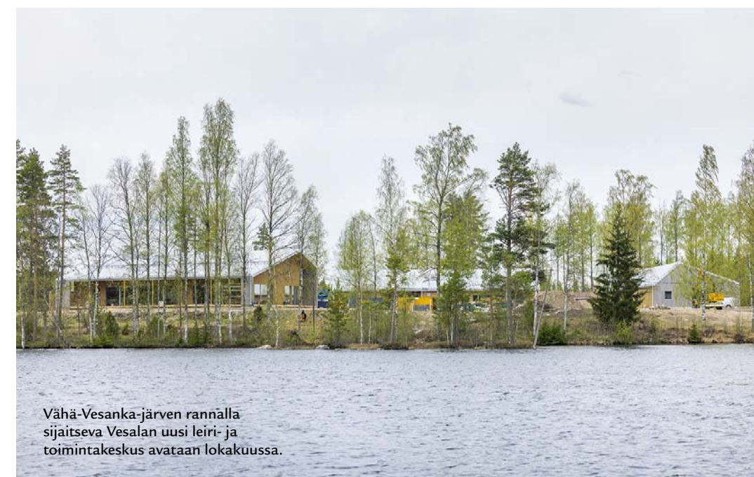
Vähä-Vesanka-järven rannalla sijaitseva Vesalan uusi leiri- ja toimintakeskus avataan lokakuussa.