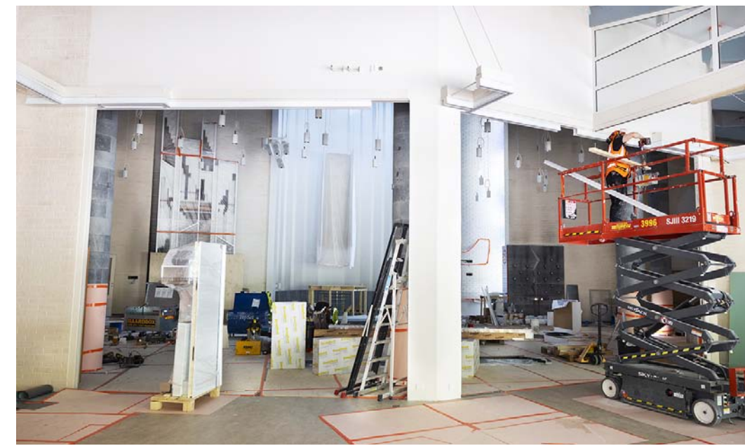
Keltinmäen kirkon remonti valmistuu kesäkuussa, jonka jälkeen alkaa tilojen kalustaminen. Toiminta uusissa tiloissa käynnistyy syksyllä.