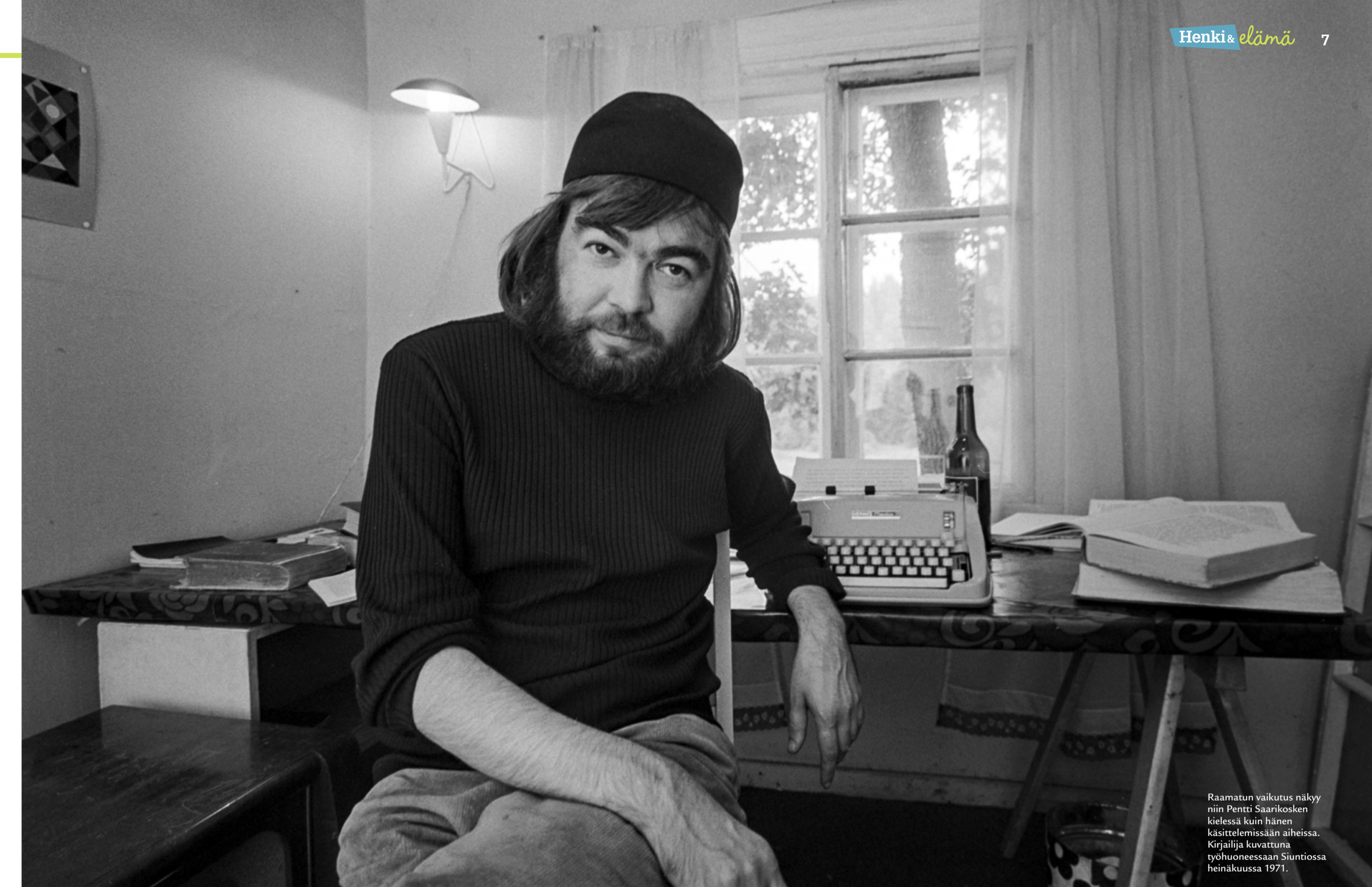
Raamatun vaikutus näkyy niin Pentti Saarikosken kielessä kuin hänen käsittelemisään aiheissa. Kirjailija kuvattuna työhuoneessaan Siuntiossa heinäkuussa 1971.

– Käännöstyönsä aikana hän oli sekavasmielentilassa, pahimmillaan sairaalakuunnossa. Mutta ei se käännös huonokaan ole.