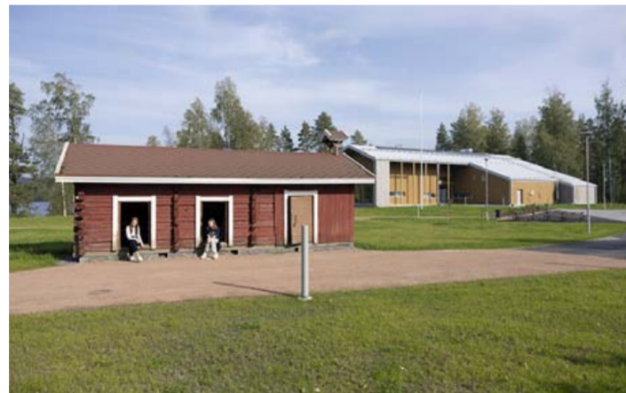
Pieni hirsirakennus säilyi. Taustalla uusi päärakennus, Rantakeidas.