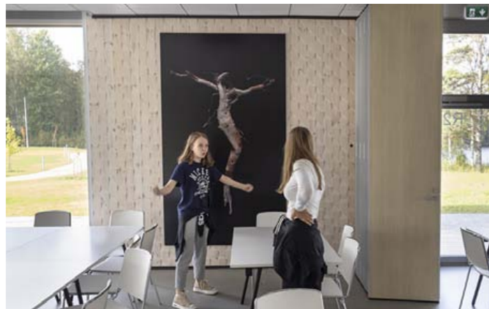
Tulevat rippikoululaiset suojaisivat taulun roiskeita.