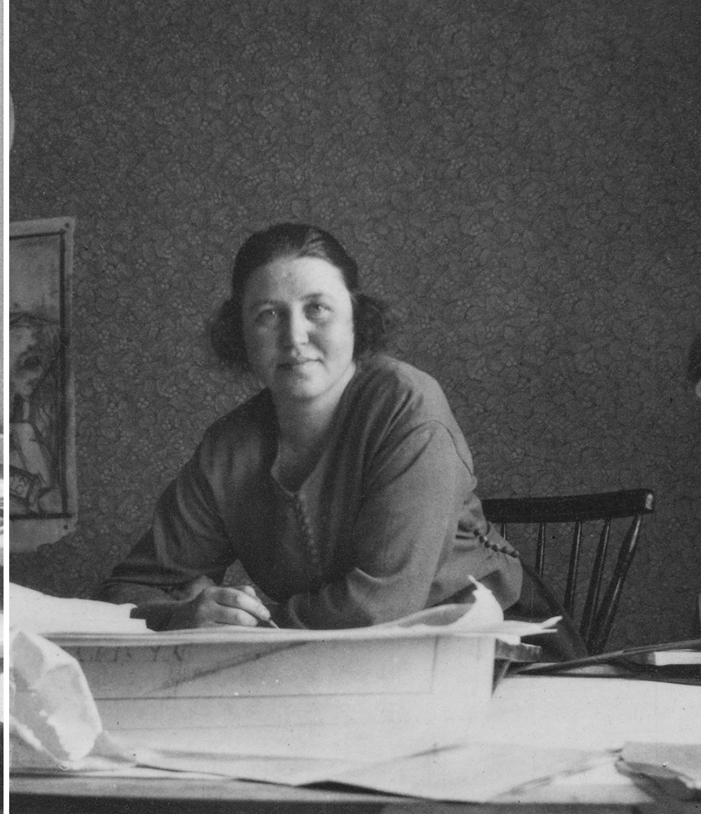
Alvar Aalto perusti Arkkitehtuuri- ja monumentaalitaiteen toimisto Alvar Aallon Jyväskylän Nikolainkulmaan 1923. Helsinkiläinen arkkitehti Aino Marsio tuli toimistoon töihin 1924. Heistä tuli työ- ja aviopari, joka hurmasi arkkitehtuuripiireissä eri puolilla maailmaa