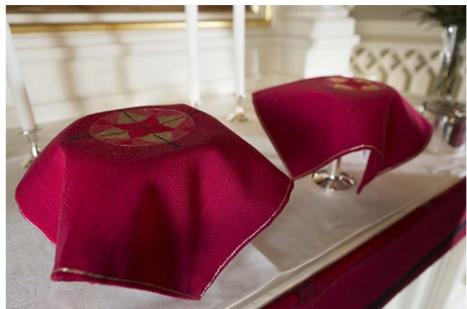
Kalkkiliinan tähtimäinen ristiaihe on Kristuksen veren symboli. Kuvionmuoto on kirkon ikkunamaalauksissa.