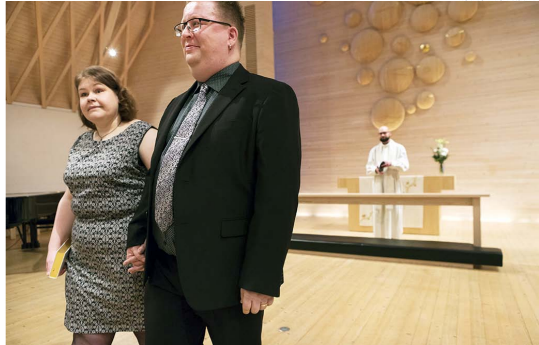
Toinen toistanne -häätapahtumassa 2.2.2020 kello 16.30 Kuokkalan kirkon alttarilta asteli pois onnellinen Pekkolan pariskunta.