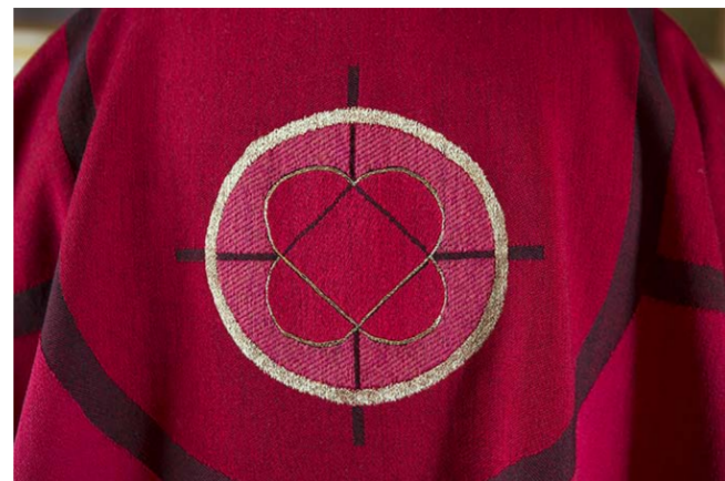
Kasukan selkäpuolen kuviointi kuvaa tässä kahta yhtenevää sydäntä, Jumalan rakkautta ihmisiä kohtaan.