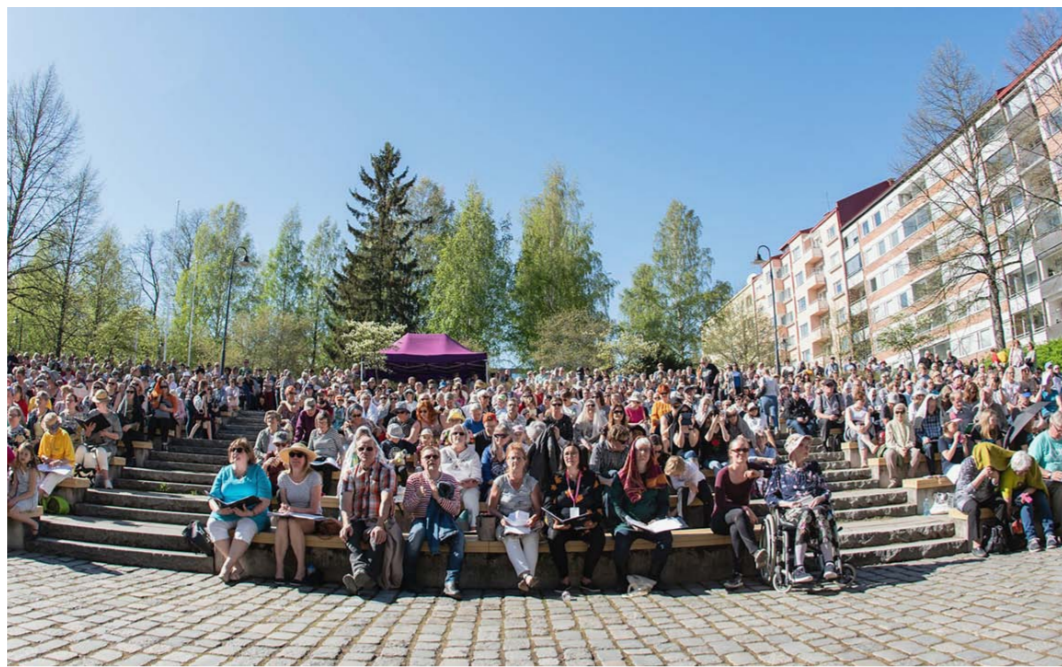
Kaksi kolmesta kirkon jäsenestä kokee kirkon roolin tärkeäksi suomalaisessa yhteiskunnassa. Jyväskylän Kirkkopäiville osallistui runsaasti väkeä viime keväänä.

Koko kirkossa jäsenyyteen sitoutuminen on yhä kohtalaisen vahvaa. Kirkon tutkimuskeskuksen teettämän kyselytutkimuksen mukaan yli puolet kirkon jäsenistä ei ole ajatellut kirkosta eroamista. Kaksi kolmesta kokee kirkon roolin tärkeäksi