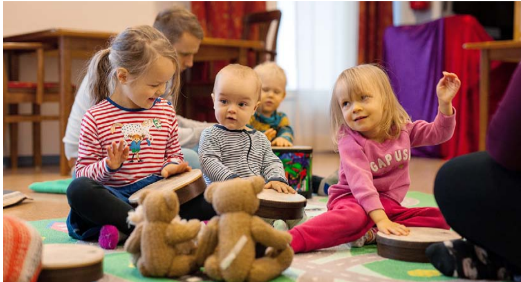
Näin iloista menoa oli muskarissa viime vuonna. Koronan vuoksi perhekerhot ovat siirtyneet nettiin, jossa vetäjinä toimivat tutut lastenohjaajat ja muskariopettajat. Luvassa on laulua, leikkiä ja vertaistukea.

– Nettiperhekerhot ovat avoimia yhdessäolon hetkiä vanhemmille, isovanhemmille, kummeille ja hoitajille yhdessä lasten kanssa. Luvassa on keskustelua, kuulemistä, laulua, leikkiä ja tukea arjessa jaksamiseen. Toiveiden perusteella kerhoissa voi olla myös erilaisia