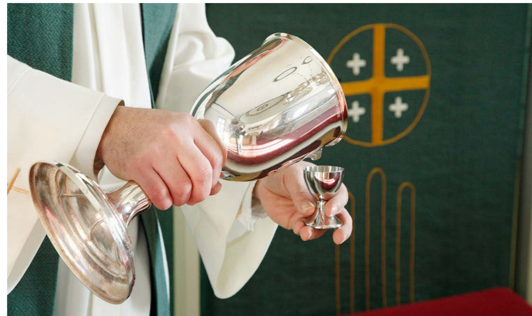
Jumalanpalvelukset, joissa seurakuntalaiset voivat olla läsnä, aloitetaan kaikissa alue seurakunnissa sekä Taulumäen kirkossa kesäkuun alussa. Ehtoollisen viettoon etsitään turvallisia toteutustapoja.

Vesalan riihikirkossa järjestettävään vihkiäisiin ja muihin tilaisuuksiin voi osallistua enintään 25 sekä Koivuniemen ja Mutasen kappelissa enintään 20 henkilöä.