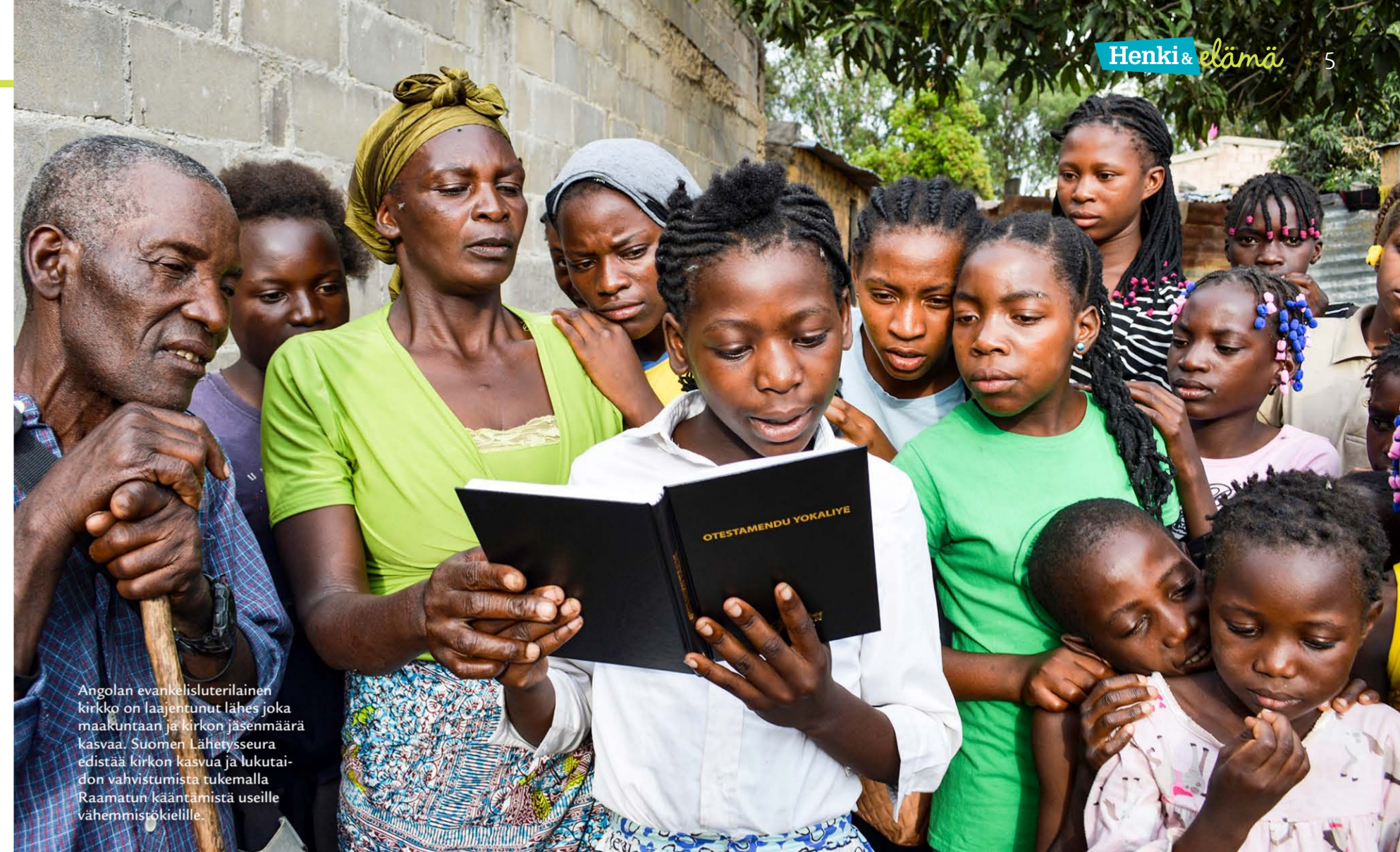
Angolan evankelisuluterilainen kirkko on laajentunut lähes joka maakuntaan ja kirkon jäsenmäärä kasvaa. Suomen Lähetysseura edistää kirkon kasvua ja lukutaidon vahvistumista tukemalla Raamatun kääntämistä useille vähemmistökielille.

Ohjeet perustuvat tilanteeseen 18.5. Tiedotamme mahdollisista muutoksista nettisivuillamme.