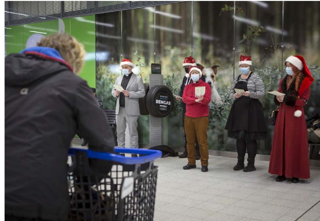
Vaajakosken alue seurakunnan työntekijät kiersivät kauppoissa ja palveluiloissa laulamassa joululauluja tiistaina 14. joulukuuta. Kello 14.45 ilahdutettiin Vaajalan S-marketin asiakkaita kaupan pihalla.