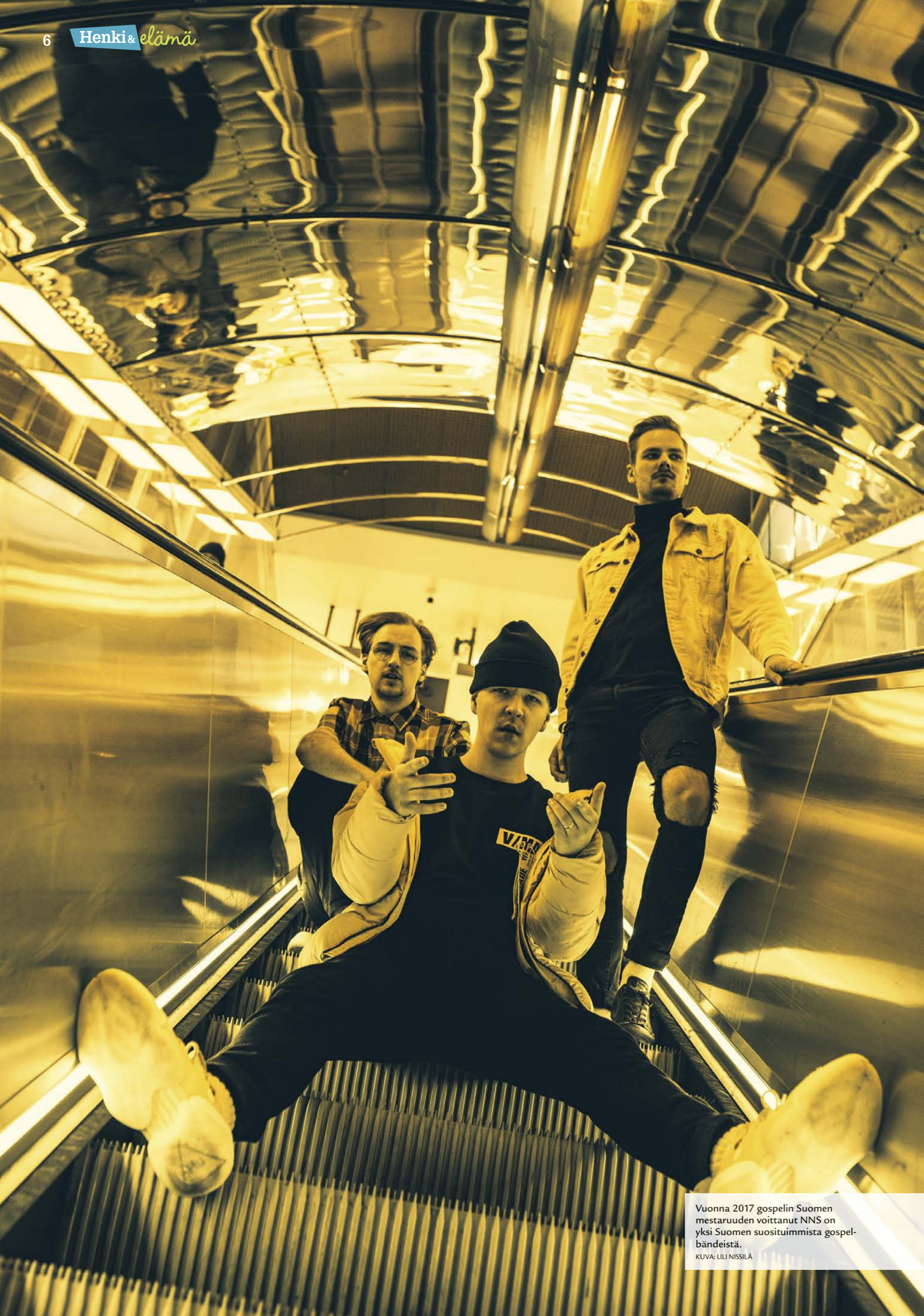
Vuonna 2017 gospelin Suomen mestaruuden voittanut NNS on yksi Suomen suosituimmista gospel-bändeistä.