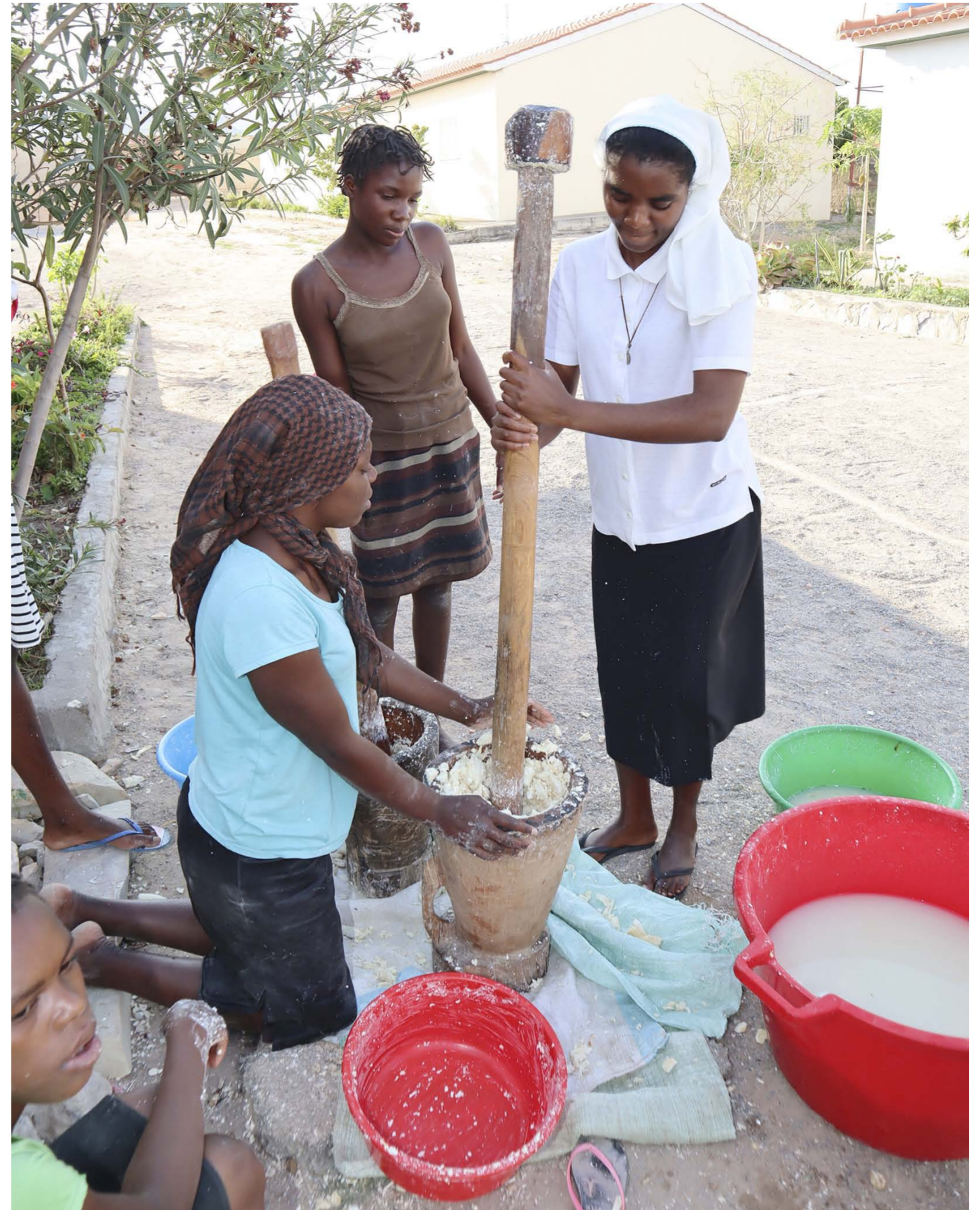
Jyväskeylän seurakunta tukee muun muassa Lubangon orpokodin toimintaa Angolassa Suomen Lähetysseuran kautta.

Kirkkovaltuustossa 12.1.2021 jätetty aloite on annettu työryhmän valmisteltavaksi. Vastaus aloitteeseen ja pönteon tuodaan kirkkovaltuuston käsiteltäväksi myöhemmin syksyllä.