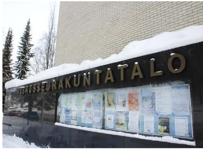
Yliopistonkadulla sijaitseva Jyväskeylän keskusseudakuntatalo on ollut pois seurakuntatoiminnan käytöstä jo useita vuosia. Lisäksi myydään muita suljettuja toimitiloja sekä tontti Palokassa.