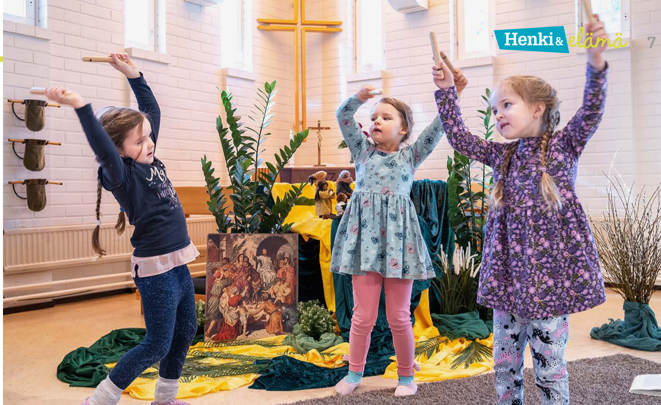
Päiväkerholaiset eläytyivät palmusunnuntain tarinaan, jossa Jeesus ratsastaa Jerusalemiin ihmisten heilutellessa palmunlehviä.