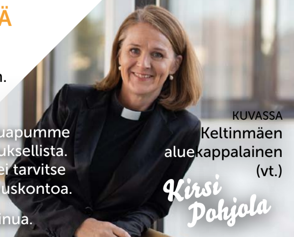
KUVASSA Keltinmäen aluekappalainen (vt.)