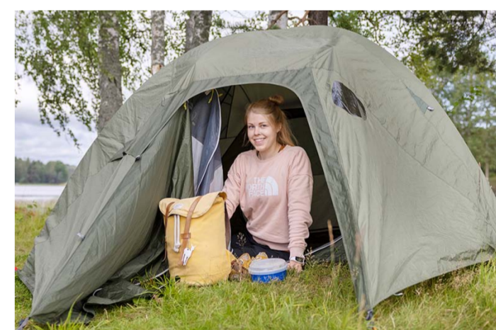
Ulkona nukuttu yön jälkeen on mukava herätä luonnon ääniin ja ihmetellä aamun valoa, Saksanen sanoo.

– Tavoite olisi käydä elämän aikana kaikissa kansallispuistoissa. Varsinkin keskisen Suomen puis-