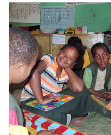
Suomi tukee Etiopiassa kehitysvammaisten lasten koulunkäyntiä.

mielestäni myös Kääriäisen kirjan yksi tärkeä viesti, Virkkunen toteaa.