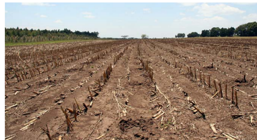
Maissipellon tieltä raivatus luonnonmetsän tilalle istutetaan eukalyptusta.