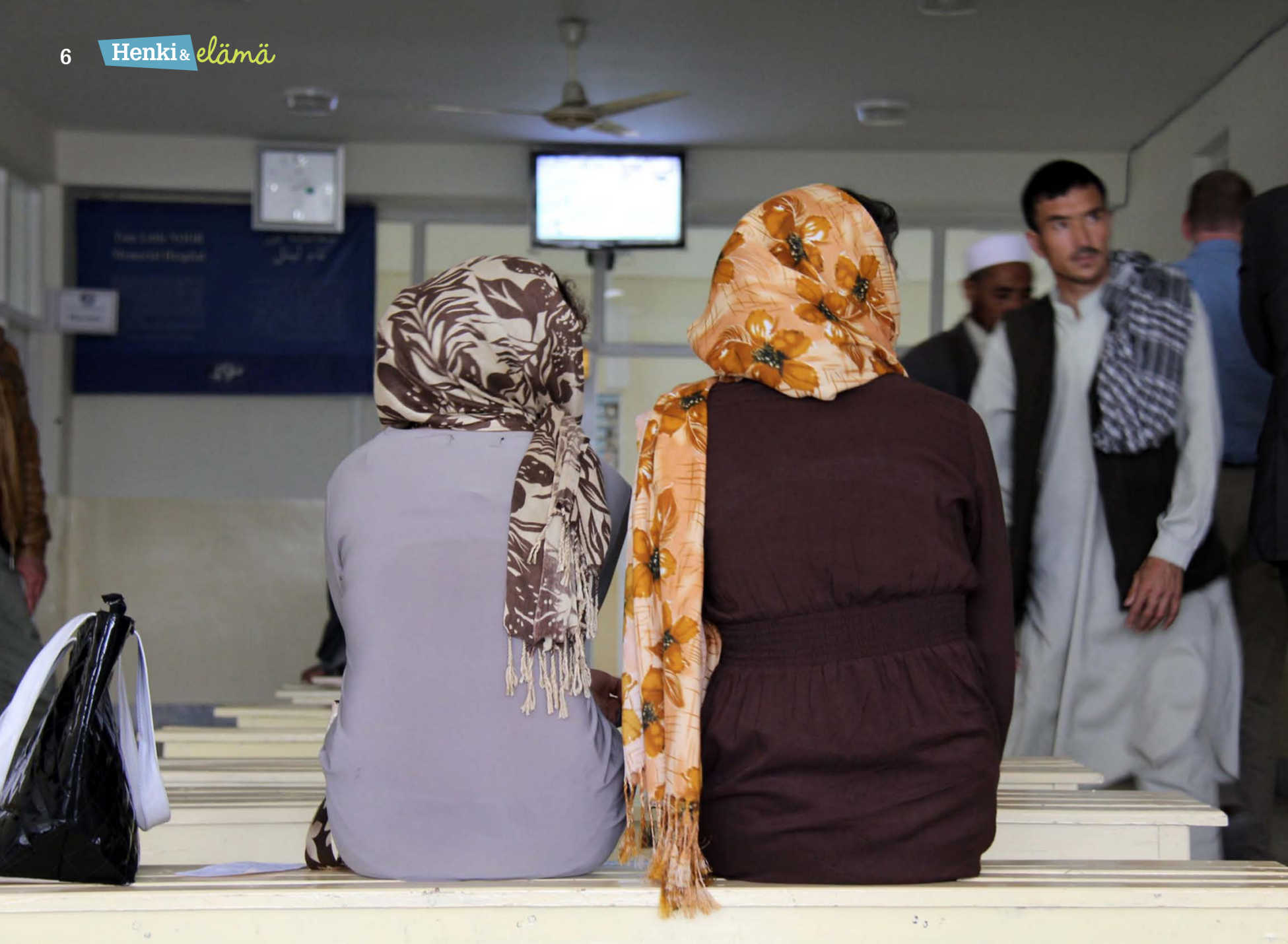
Suomen kehitys yhteistyötä Afganistanissa on tarkoitus jatkaa, kun tilanne maassa arvioidaan turvallisiksi. Suomelle Afganistanin kestävän kehityksen tukemisessa on tärkeää erityisesti naisten ja lasten aseman paraneminen. Afganistan on ollut yksi eniten kehitysapua saava maa.