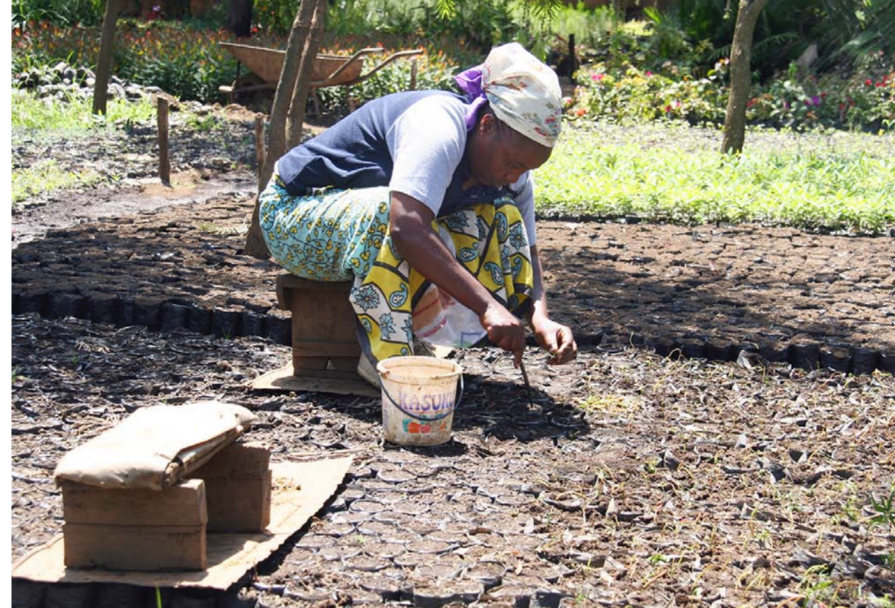
Ilmastomuutos koettelee kaikkein vakavimmin köyhiä kehitysmaita. Kehitysmaiden ilmastotoimia tuetaan osana kehitys yhteistyötä. Nainen istuttaa puuntaimia Keniassa.

– Maailmanlaajuisissa haasteissa, kuten ilmastomuutos, tarvitaan laajaa yhteistyötä ja kokonaisvaltaista näkemystä. Tämä oli