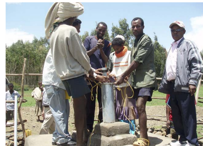
Kehitys yhteistyön avulla toteutettu Amharan vesihuoltohanke on tuonut puhdasta vettä yli miljoonalle etiopialaiselle.

Suomen vaikuttamistyö arvioitiin ulkoministeriön teettämässä selvityksessä vuonna 2020 tulokselliseksi. Suomea pidetään luotettavana, johdonmukaisena ja ammattitaitoisena kumppanina.