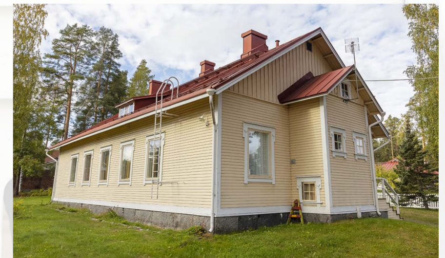
Paratiisisaaret ry on vuokralla Säynätsalon pappilassa.