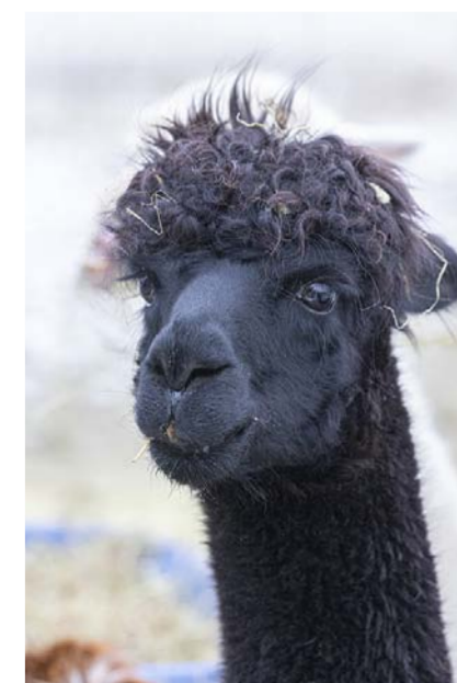
Haanpään tilalla on 16 uteliasta alpakkaa, jotka pitävät huolen, että jokainen niistä huomataan. Jokainen alpakoista on omanlaisensa persoona.