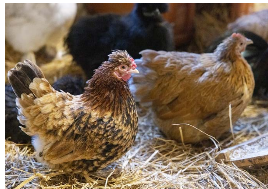
Tallissa voi kuulla myös kanojen kaakatusta.