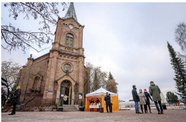
Seurakuntavaalien varsinainen vaalipäivä oli 20. marraskuuta.