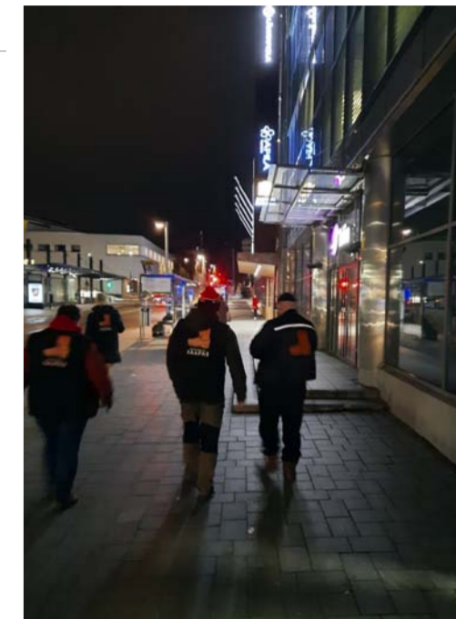
Saapas jalkautuu kaduille kerran viikossa maaliskuusta lokakuun loppuun.

mä on sekaisin koko ajan. Osa ei pääse ongelmistaan eroon, ja jotkut päätyvät haittaumaalle.