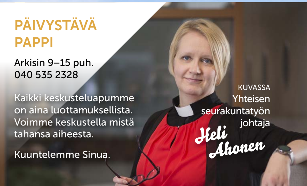
KUVASSA Yhteisen seurakuntatyön johtaja