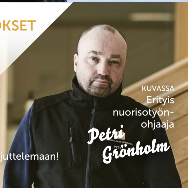
KUVASSA Eriyis nuorisotyön- ohjaaja