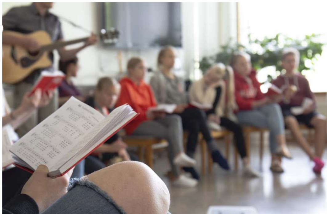
Lasten ja nuorten toimintaa on pyritty Jyväskylän seurakunnassa rajoittamaan mahdollisimman vähän. Myös rippikoulu on voitu aloittaa koronaturvallisesti pienemmissä ryhmissä (arkistokuva).

seurakuntaan voi olla yhteydessä matalalla kynnyksellä avun ja tuen saamiseksi, Ahonen muistuttaa.