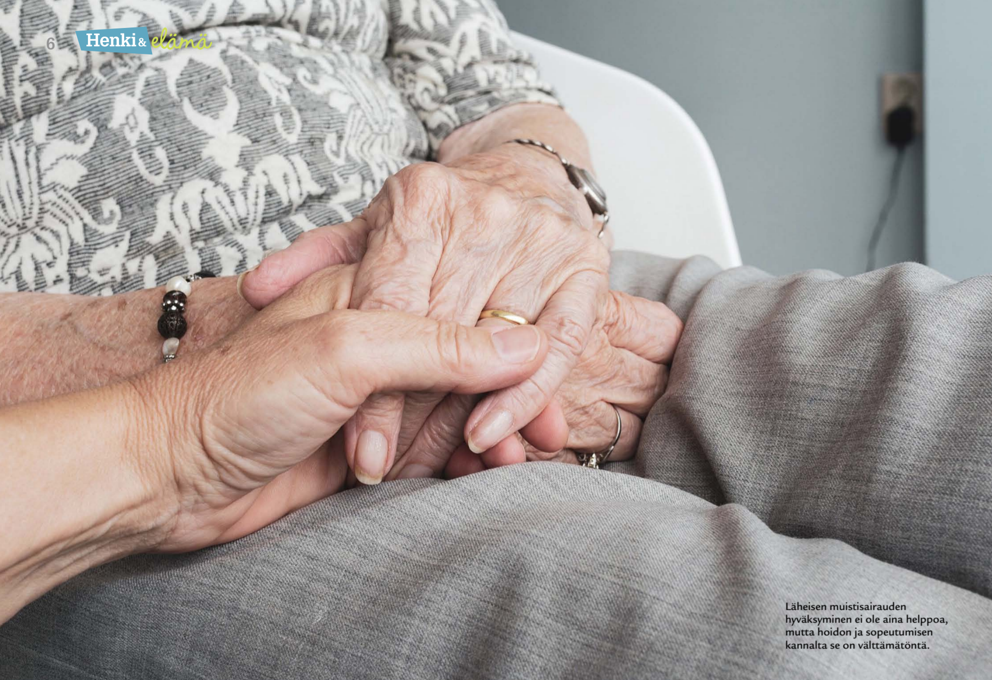
Läheisen muistisairauden hyväksyminen ei ole aina helppoa, mutta hoidon ja sopeutumisen kannalta se on välttämätöntä.