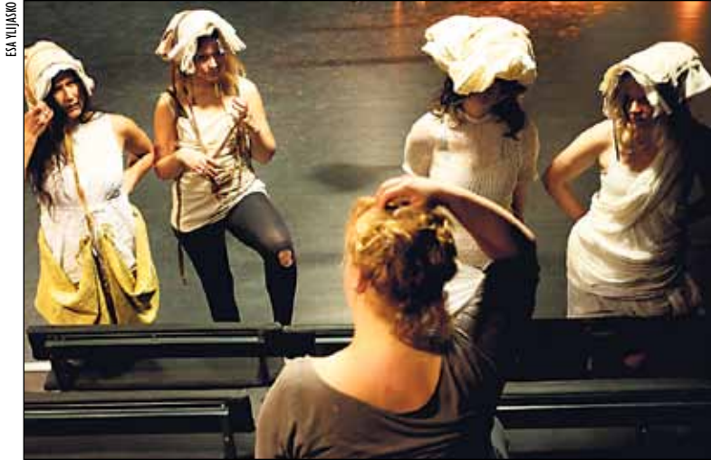
Buto on Japanissa toisen maailmansodan jälkeen syntynyt taidemuoto, jossa ihminen nähdään osana luontoa. Suomalainen butotanssi ammentaa voimansa vuosisatoja vanhasta kansaperinteestämme.

Vaikka esityksessä on synkempiäkin sävyjä, Potila toivoo, että teos toisi katsojille paljon positiivisia tuntemuksia.