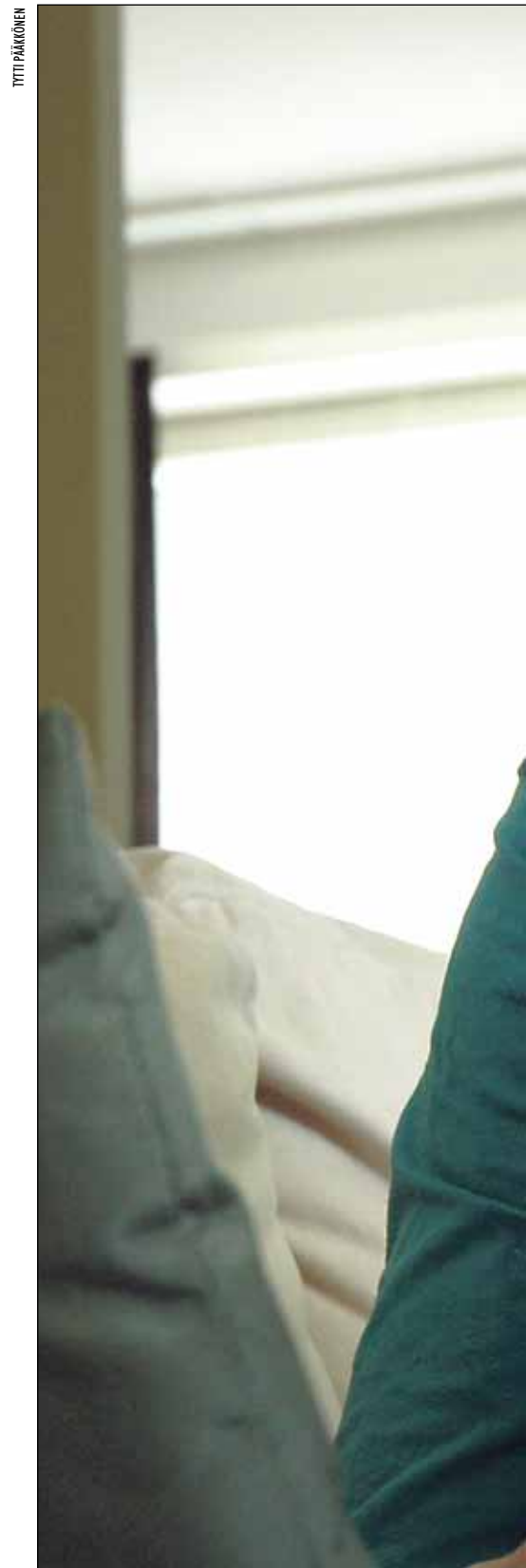
Mummon ja lapsenlapsen laatu-aikaa.